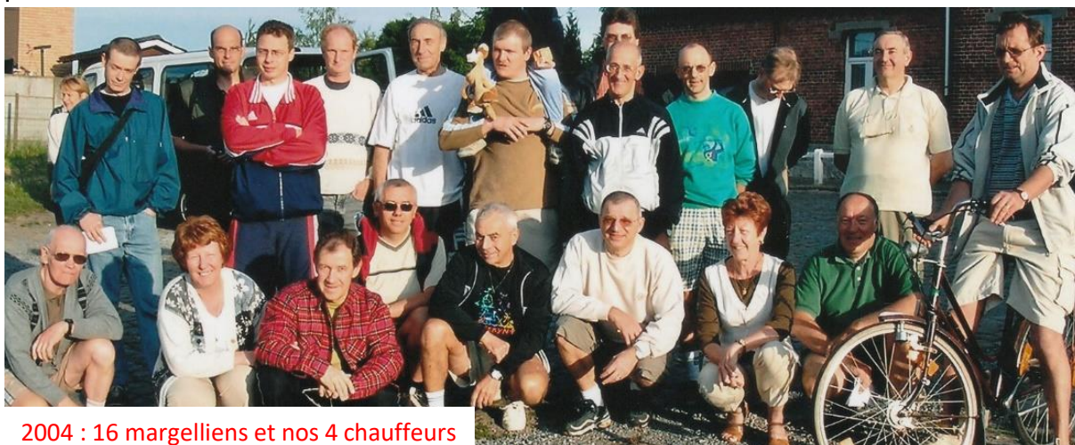
2004 : 16 margelliens et nos 4 chauffeurs

Après Savona, quelques bosses vous distrairont mais ne sont pas pénibles. Ensuite, il y aura de nombreuses plages, des endroits agréables à regarder et c'est ce dont vous ne devez pas vous priver.