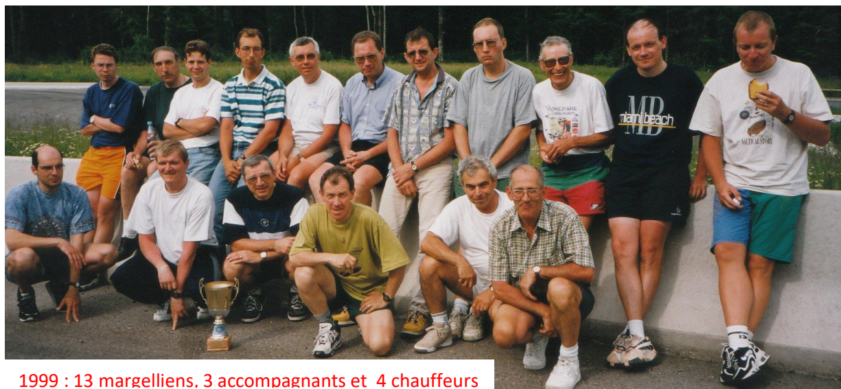
1999 : 13 margelliens, 3 accompagnants et 4 chauffeurs

Il ne faut pas oublier qu'il y a d'autres moyens de se rendre à Milano. Mais tout cela dépendra du nombre de participants car il y a peut-être d'autres solutions et qui seraient moins onéreuse. Mais pour cela il est nécessaire que vous fassiez connaître votre intérêt le plus rapidement possible. Si vous n'êtes pas très nombreux, il y aurait une possibilité de pouvoir partir en camionnette ce qui serait moins coûteux. Il faut prévoir être plusieurs à prendre le volant et suivant le parcours emprunté, il y aura des péages, des taxes comme la Suisse. Il vous faudra relever les inscriptions la veille du départ, prévoir de quoi ne pas avoir une fringale.