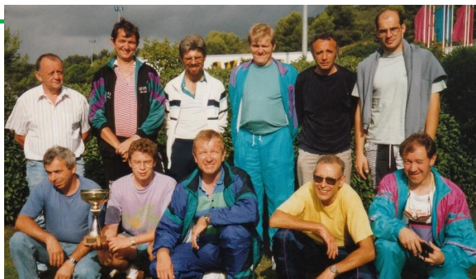
1993 : 7 margelliens, 3 accompagnants et 2 chauffeurs

Afin de pouvoir visionner tous les renseignements dont vous aurez besoin, activez le site des organisateurs : https://milano-sanremo.org/fr/