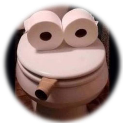
Mon ami de confinement

Tiens qui v'là, l'emmerdeur est toujours là, alors que gr..... Encore un peu de patience et il sera éradiqué. Vous vous demandez peut-être ce qui a changé dans la vie du p'tit. Vous serez étonné de constater qu'il n'y est pas allé de main morte. Devinez ce que peut faire un p'tit mètre 80 !