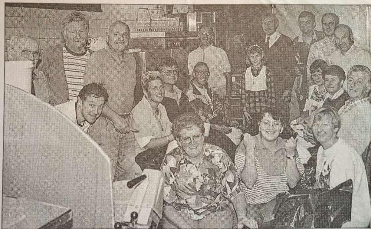
Les cyclos de la Margelle qui ont organisé leur souper de fin de saison..